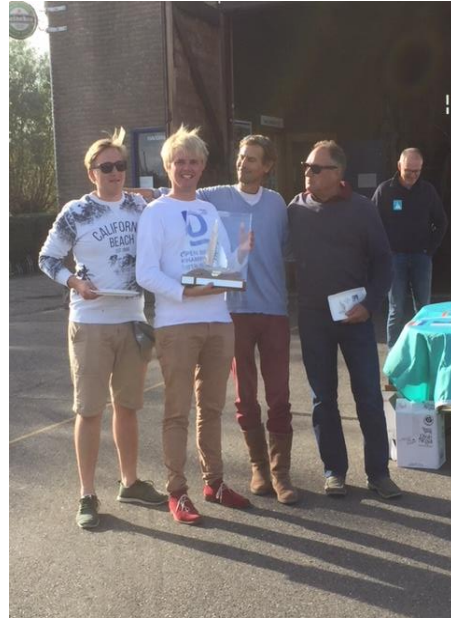
Winnaars Grand Prix d'Alkmaar